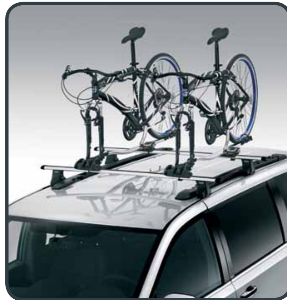
PORTABICI BIKE CARRIER

Con attacco su forcella. Vincolato alle barre portatutto KTR758670. Fork Mount Bike Carrier. To be fitted in the roof bars KTR758670.