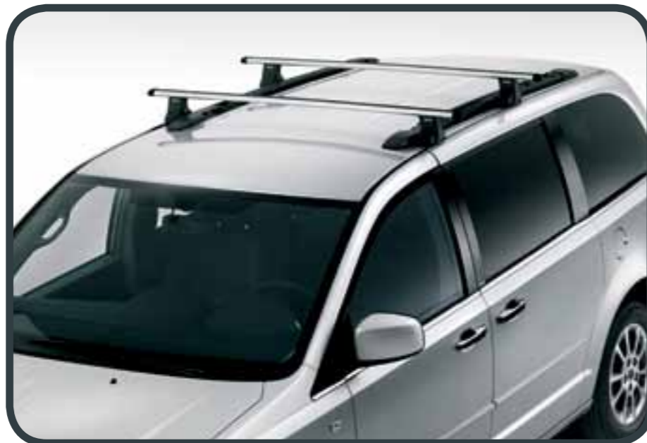
BARRE PORTATUTTO CROSS BARS