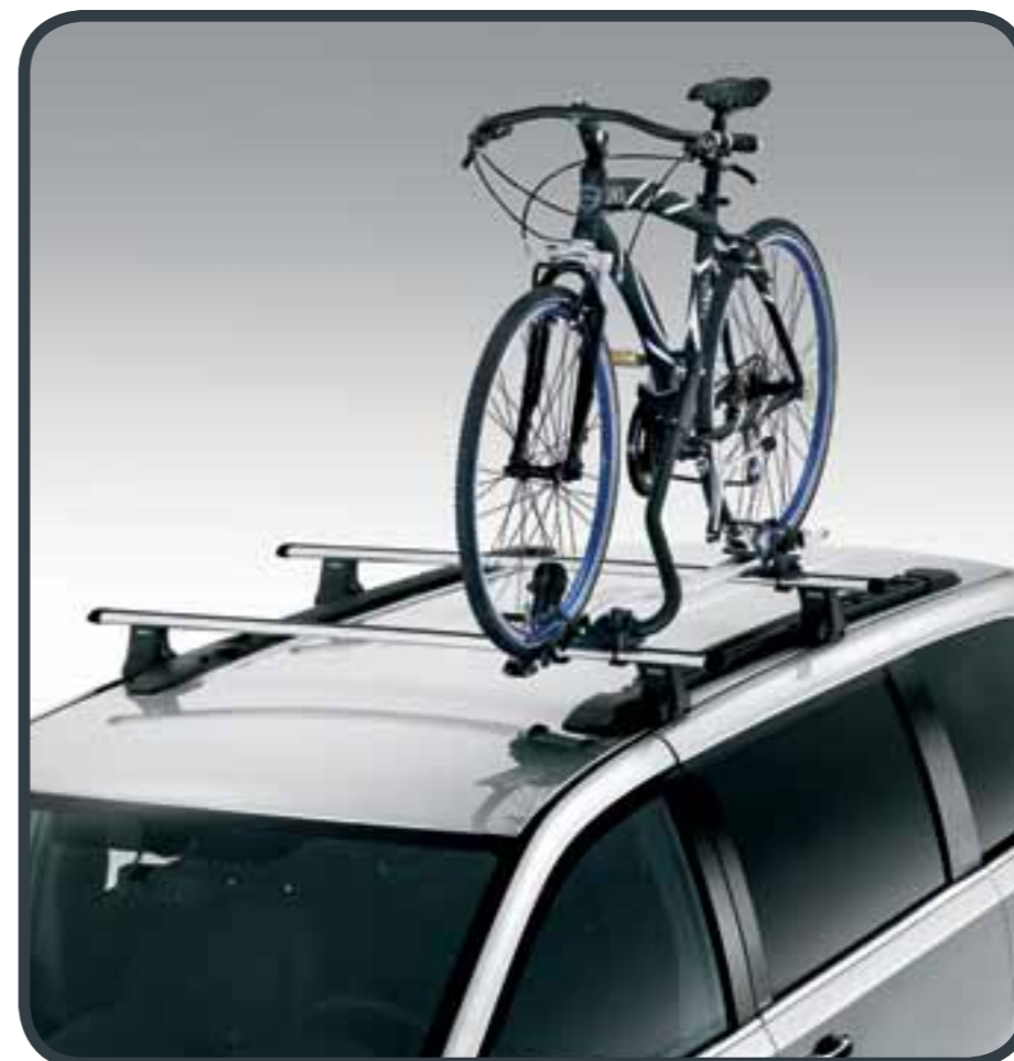
PORTABICI BIKE CARRIER

Da montare sulle barre portatutto KTR758670. To be fitted in the roof bars KTR758670.